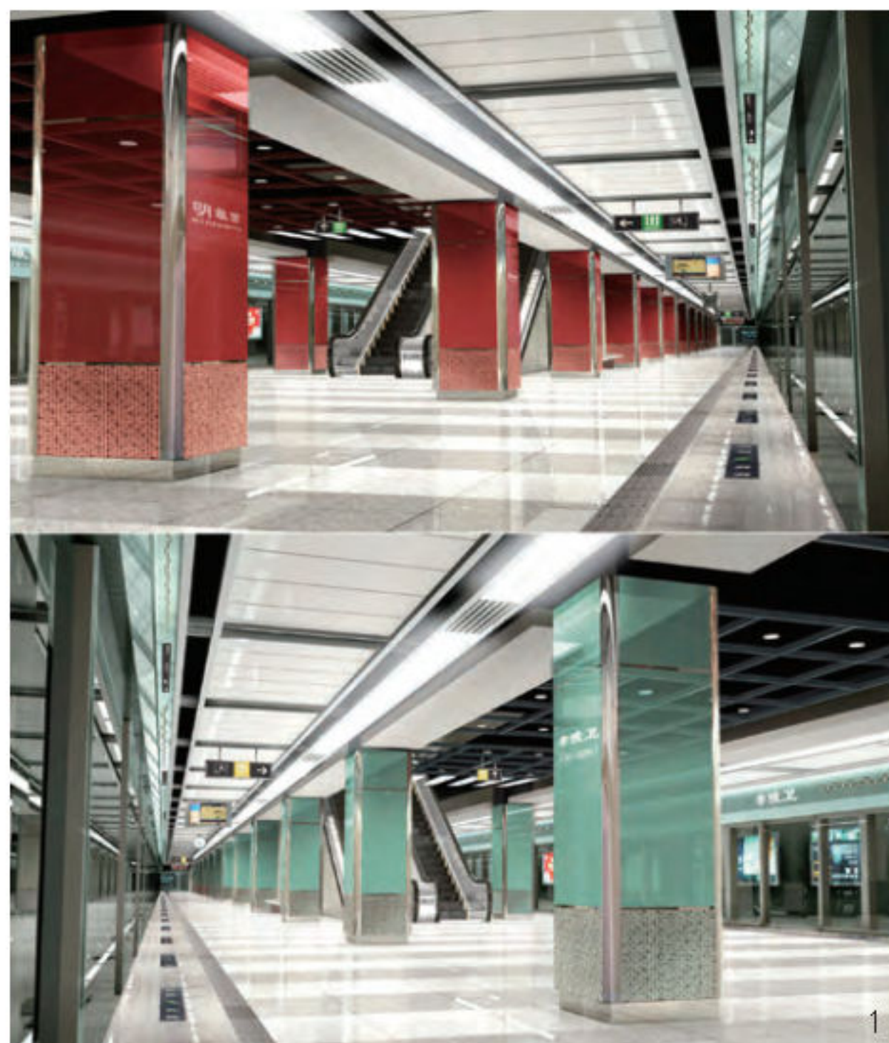
1. 南京地铁2号线明故宫站（上）、孝陵卫站（下）

其三是堆积装饰材料。1998年和1999年分别通车的巴黎地铁14号线（Meteor线）和英国地铁朱比利（Jubilee线）延长线展现了西方地铁设计的当代特征。尽管两条线分属不同国家，但二者设计理念有内在的一致性，即强调结构、艺术与室内设计的一体化，通过丰富的空间形态满足功能并体现艺术性，尽量展示原有建筑的结构美和材质美，只在必要的界面进行适度装修。而我国地铁站设计主要采用先结构后装修的操作模式。原因是我国地铁站（主要指地下站）空间形态一般比较简单，车站前期设计主要以结构工程师为主导，室内设计师介入较晚。室内设计师接手项目后，为了隐藏原有建筑结构和设备在形式上的缺陷，往往采用全装修的手法对车站公共空间所有界面进行遮蔽。所谓“设计”，也仅是被动地通过大量使用装饰材料去美化空间环境，结果是既浪费了材料资源，又减少了空间容积，更不利于后期维护。当然，采用这种堆积材料的设计手法也是国内设计师的无奈之举，但不代表适当的设计策略没有减弱材料堆积感的可能性。