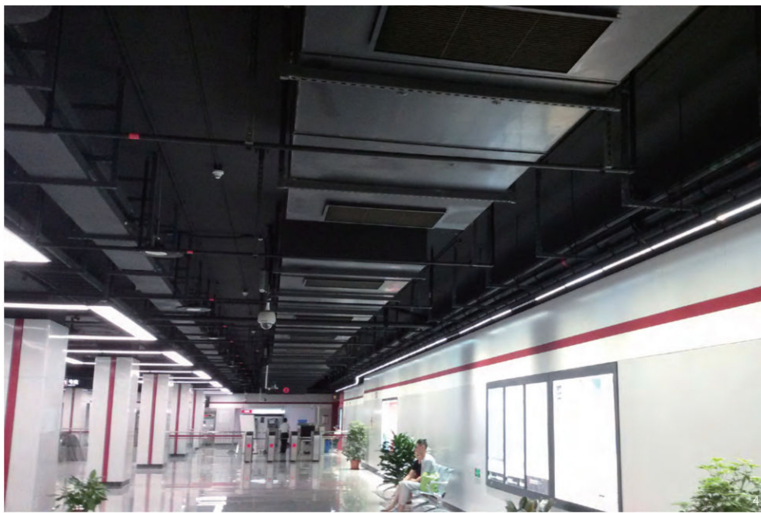
4. 上海地铁 11 号线龙耀站

是异形板，每平方米价格要超过 1000 元，高昂的价格往往使建设方难以承受。其实，空间环境的品质与造价并无对等关系，采用“适宜性”选材策略，合理选用装饰材料，将不同价位材料搭配使用，同样能取得较好的设计效果。