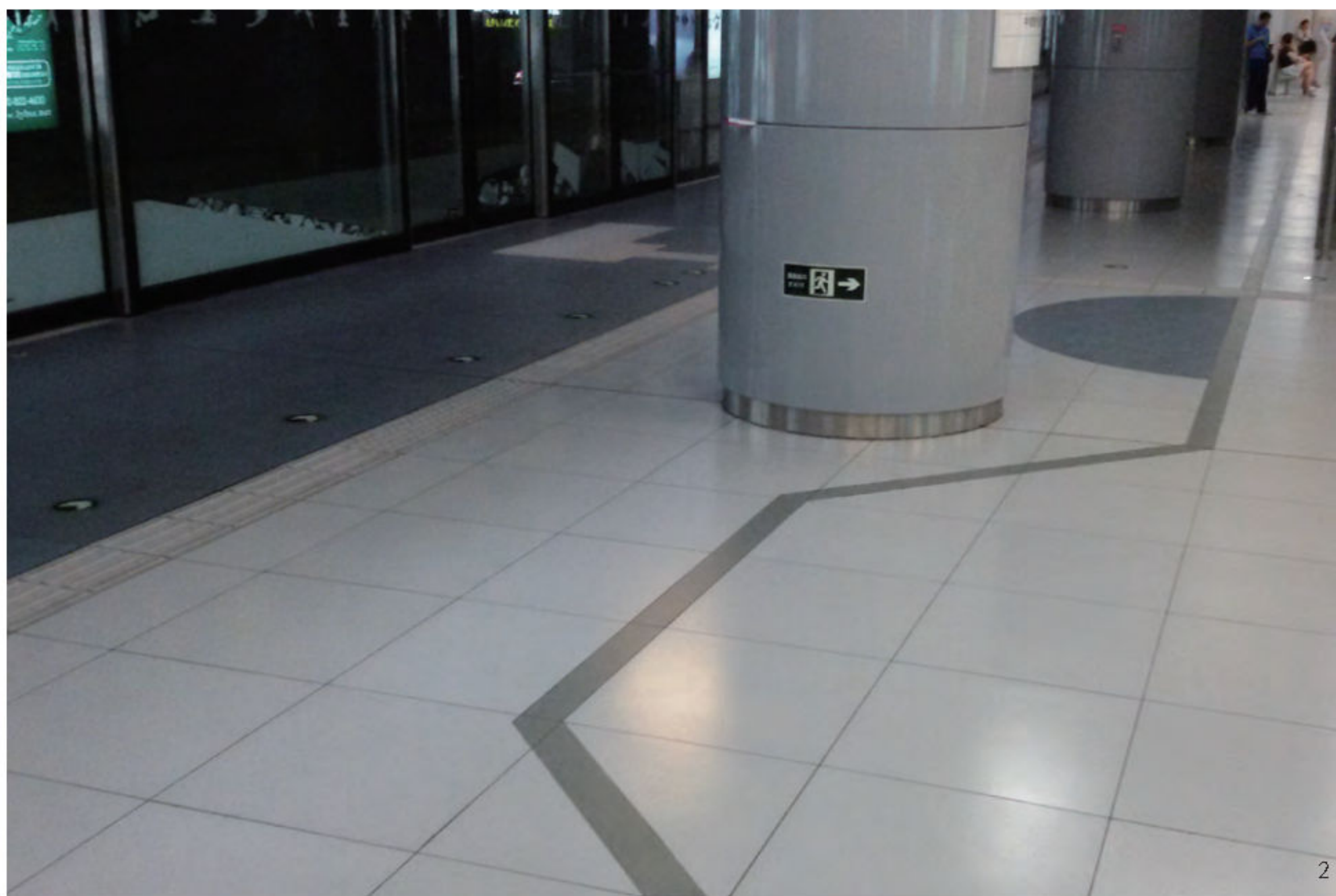
2. 北京地铁8号线奥体中心站站台层的地面设计

因素,不同因素的组合又能构成丰富多彩、千变万化的新事物。模块化就是建立在分解与组合理论基础上的,一些相同或相似的单元可以采用标准化的原理分解、提炼出来,然后通过简化和优化,形成标准单元的独立形式,即单元模块 [6] 。标准化的模块具有通用性和互换性,方便快捷生产、运输、安装和更换,节省资源消耗,将其原理用于地铁站的设计,同样可以